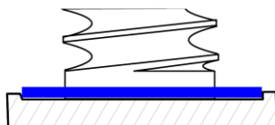
mit Nut nach DIN 3852 E

precote 200 ist eine Unterkopfbeschichtung zur Abdichtung von Flansch-, Bundschrauben und Nieten. Abhängig von der Geometrie der Gewindebohrung und des Flansches bzw. des Schraubenkopfes ist eine Wiederverwendung möglich (siehe Abbildung). Die Beschichtung darf bei der Montage nicht mechanisch überlastet werden.