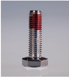
Klemmbeschichtung für Gewinde